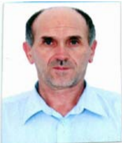
Эмен вехъ вукъаниги, Хьихъичъо дица гъиял.

Ах-хуралгъул халтгъулгъи Вецичъо дун лъицаго.