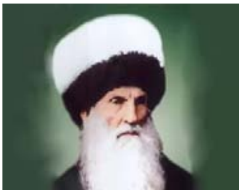
Рахъму цикъикъарасда Рахъман гурхъула Дунял гъабугаго Аллагъи къочонге!

Жакъа намусгун-яхъи гъарцухъ бичарас Метер гъагараб ракъ къола меседихъ,