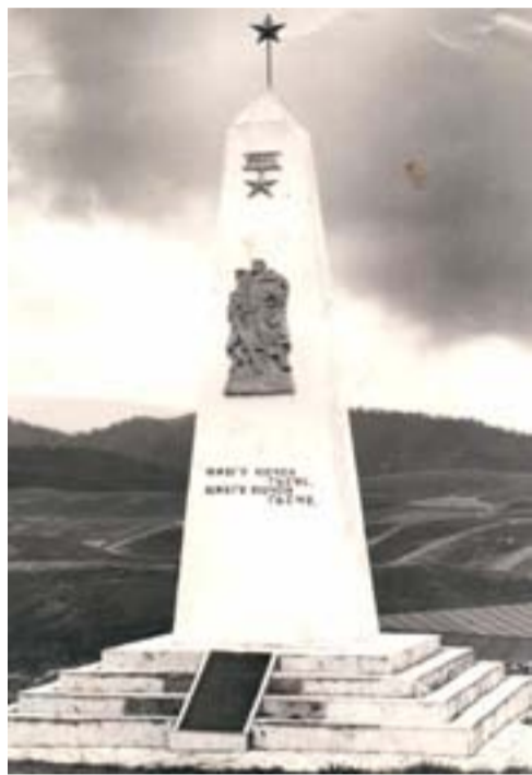
(Байбихъи араб номералда)

Рагъул тлоцесел къояздаса нахъего цакъго тлад кIвар къун гъабубеб буклана нухал къачай ва циял нухал гъари. Кидагосеб хъаравулгъиялда гъоркъ буклана чезабун Чиркъатласа Унсоколобе ва гъенисан росабалгъе почта рехиялгъул хIалтИи.