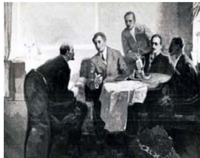
Тлахьал цалун толел гьечин, кьулчулел ругин.

Жиндирго рукьялзул библиотекаялде гьевги виччан, хадув валагун члараб мехалда, Максимида кколаан гьес